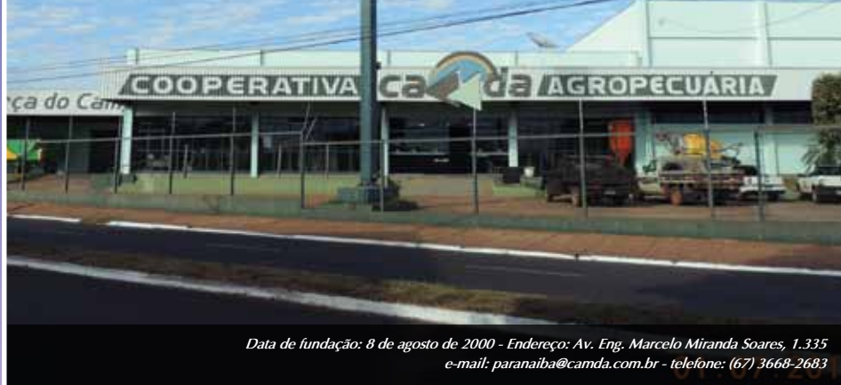
Data de fundação: 8 de agosto de 2000 - Endereço: Av. Eng. Marcelo Miranda Soares, 1.335 e-mail: paranaiba@camda.com.br - telefone: (67) 3668-2683