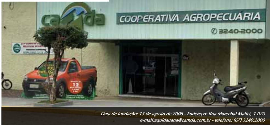
Data de fundação: 13 de agosto de 2008 - Endereço: Rua Marechal Mallet, 1.020 e-mail: aquidauana@camda.com.br - telefone: (67) 3240.2000