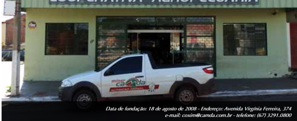
Data de fundação: 18 de agosto de 2008 - Endereço: Avenida Virgínia Ferreira, 374 e-mail: coxim@camda.com.br - telefone: (67) 3291.0800